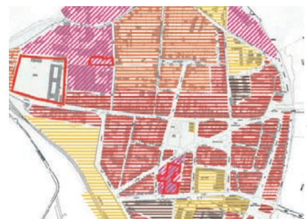
Étude urbaine sur Montauban «Typologie de l'occupation du sol sur les deux quartiers de Sapiac et Villebourbon.

Le taux de financement maximum est de 50 % (études), 40 % (travaux de prévention) et 25 % (travaux de protection).